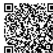
テクニカルノート