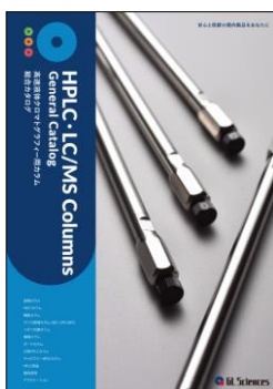
HPLCカラム総合カタログ

その他のInertSustain、Inertsilの詳細については、弊社ホームページをご参照いただくか、下記QRコードよりカタログをご確認ください。