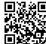
インターネット検索/テクニカルノート