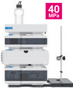
Agilent 1260 Infinity II クォータナリ VL LC システム