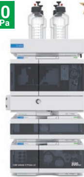
1260 Infinity II Prime LC